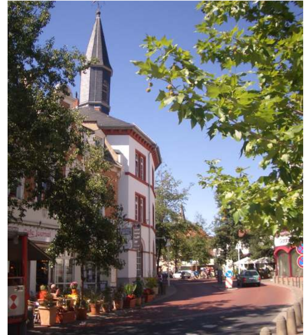
Georg-August-Zinn-Straße September 2004