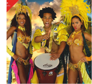
BAHIA DANCE GROUP Samba