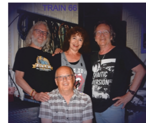
TRAIN 66 Oldies, Blues & Rock "Wendelinus Park"/Georg-A.-Zinn-Str.