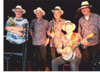
PETITE FLEUR Jazz & Blues Band "Brücke Ohl"/Georg-August-Zinn-Str. 23