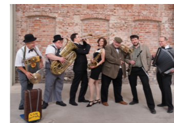
LAUREL & HARDY'S DIXIE BAND New Orleans-Dixieland-Music "Goldene Krone"/Markt 7