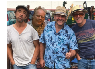
LOS MANOLOS Folk-Rock-Americana "Weinscheune Emmerich"/Wallstraße 29