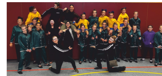
FABDANCE COMMUNITY Tanzgruppe