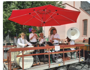
AUTMUNDIS SWINGTETT Swing & Dixie ab 14 Uhr Warming up Marktplatz