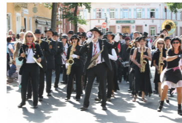
MARCH MELLOWS STREETBAND BluesJazzSwingSoul Parade & Marktplatz