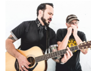
BEYOND THE BEND Acoustic Rock "Bistro du Chateau"/Markt 4