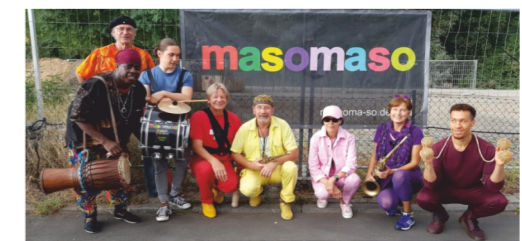
MASOMASO Rumba, Salsa, Funk, mal Swing, Jazz-Standards bei der Parade und danach auf dem Marktplatz