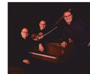
VOKAN SWINGQUARTETT Jazz & Blues "BiancoNero"/Am Darmstädter Schloss 6