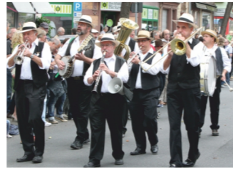
ZIMMERNER KERB DIXIE STOMPERS Dixie-Schoppe-Jazz ab 11 Uhr 30 "Umstädter Brauhaus"/Zimmerstr. 28