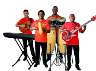
LOS 4 DEL SON Salsa, Merengue, Bachata, Son "La Dolce Vita"/Obere Marktstraße 3 + 4